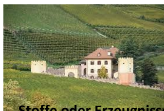
Stoffe oder Erzeugnisse, die

Sollten gewisse Stoffe oder Erzeugnisse bei den Kindern Allergien oder Unverträglichkeiten auslösen, teilen Sie uns dies bitte bei Bestellung mit.